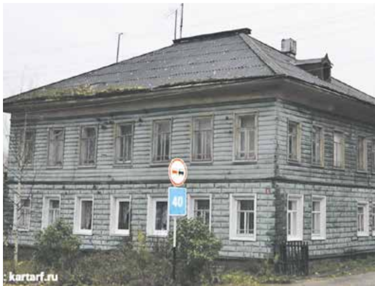
воя в таких условиях?

Капитальный ремонт дома запланирован на 2037 год. Очевидно, в качестве подарка на 200-летний юбилей здания и 85-летие его обитательницы. Но вот дождётся ли она его, прожи-