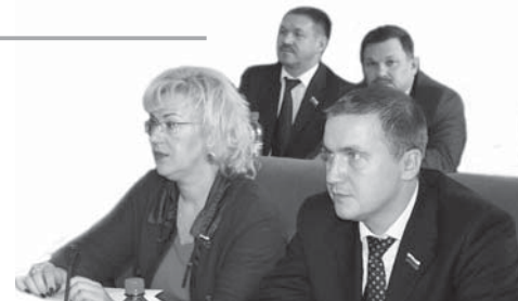
Фракция «СПРАВЕДЛИВОЙ РОССИИ» в Облсобрании

Архангельские справедливороссы подвели итоги работы