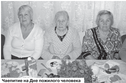
Чаепитие на Дне пожилого человека

Задаю следующий логичный вопрос: «А что, работает только СПРАВЕДЛИВАЯ РОССИЯ? Как же другие партии?» Наступает драматичная пауза. И кто-то задумчиво произносит: «Мы и не помним, чтобы сюда приезжали,