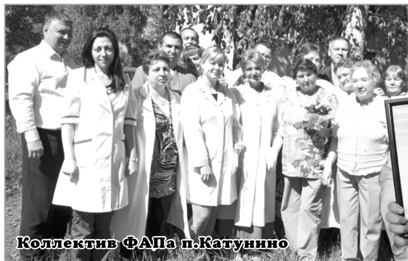
Коллектив ФАПа п.Катунино