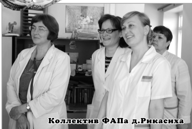
Коллектив ФАПа д.Рикасиха