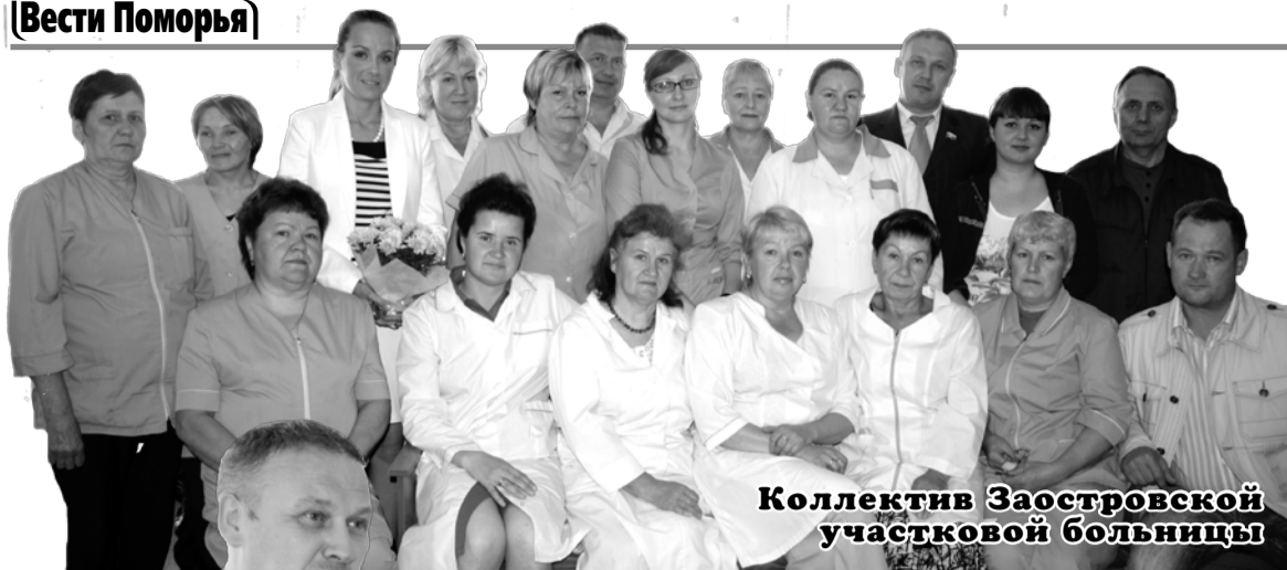
Коллектив Заостровской участковой больницы