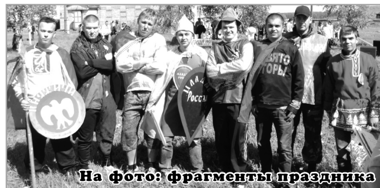
На фото: фрагменты праздника