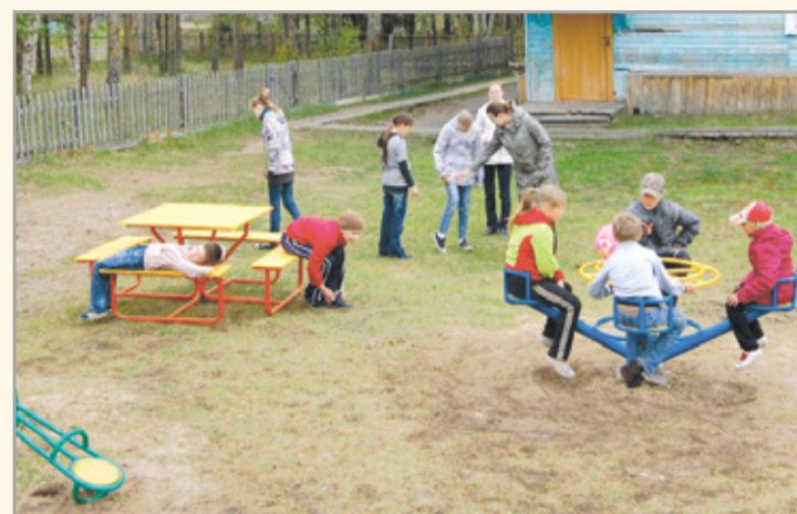
Площадка в п.Пертоминск