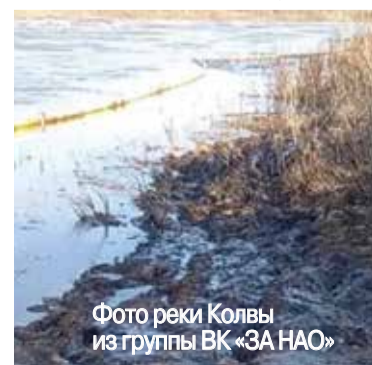
Фото реки Колвы из группы ВК «ЗА НАО»