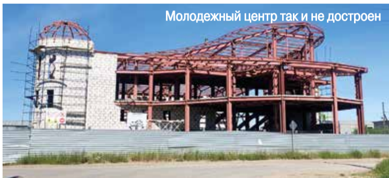
Молодежный центр так и не достроен